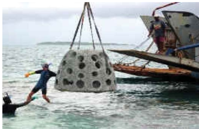
ნახ. 2.1. რიფბოლის საერთო ხედი

სანაპიროს გარანტირებული დაცვის მიზნით, ზემოთ აღწერილი ღონისძიებების ჩატარების შემდეგ, მიზანშეწონილი იქნება დამატებით ნაპირგასწვრივი წყალქვეშა გამჭოლი ტალღმსხვრევის შექმნა. ტალღმსხვრევი წარმოადგენს სამ რიგად ჩანყობილი ბეტონის ფიგურებისგან, ე.წ. რიფბოლებისგან შექმნილ წყალქვეშა რიფს, რომელიც შეიძლება ჩალაგდეს ნაპირიდან 3-5 მ სიღრმეზე წყვეტილი რიფების სახით. რიფბოლებისგან შემდგარი რიფის ერთი რიგის სიგრძე უნდა იყოს 150 მ, ხოლო რიგებს შორის მანძილი 70-80 მ. თვით რიფბოლის სიმაღლე 1.52 მ, ხოლო სიგანე 1.83 მეტრია (ნახ. 2.1).