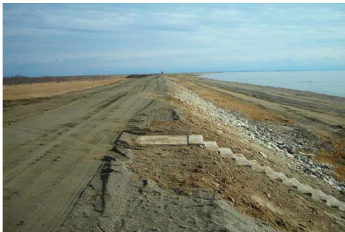
ნახ. 2.2. ხელოვნური ზვინულის საერთო ხედი

ზღვის დონის სწრაფი აწევის დროს (6-7 მმ/წელი), როდესაც სანაპირო დიუნები ვერ ასწრებს ხმელეთის სიღრმეში გადაადგილებას, საჭირო გახდება სანაპირო ზვინულის პარამეტრების ხელოვნურად გაზრდა, განსაკუთრებულ შემთხვევაში კი – ხელოვნური დამბის აშენება. ზღვის დონის სწრაფი აწევის პირობებში ზვინულის სიმაღლე უნდა გაიზარდოს 4 მეტრამდე, ხოლო სიგანე – 300 მეტრამდე და რეგულარულად მოხდეს მსხვილფრაქციული მასალის ჩაყრა სანაპიროს სტაბილიზაციისთვის. ნახ. 2.2-ზე ნაჩვენებია ხელოვნურად გაზრდილი სანაპირო ზვინულის საერთო ხედი.